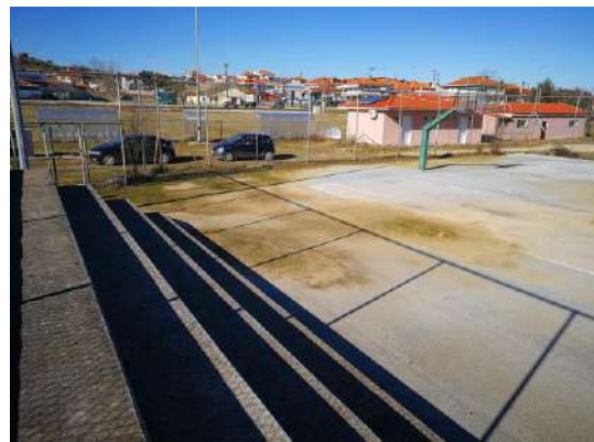
Φωτο. 5,6,7&8 Εμφανείς οι εκτεταμένες φθορές των δαπέδων των γηπέδων λόγω της αδυναμίας απομάκρυνσης των ομβρίων υδάτων (Νέα Ρόδα)

δ. Τέλος για την προστασία των γηπέδων από τους επικρατούντες ανέμους θα γίνει φύτευση πράσινου ανεμοφράκτη ( Cupressocyparis leylandii ) στην βόρεια, ανατολική και νότια πλευρά των γηπέδων. Για την άρδευση των νέων φυτών θα κατασκευαστεί αυτόματο σύστημα άρδευσης με σταλακτηφόρους σωλήνες Φ20.