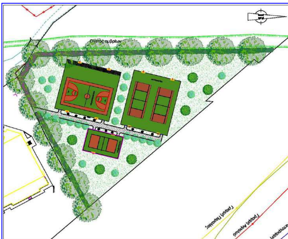
Σχ. 1 Γενική διάταξη του χώρου μετά την παρέμβαση (Ιερισσός)

β. Στα τρία γήπεδα θα γίνει επίστρωση ελαστικού τάπητα τύπου SPORTSOL πάχους 1,6-2 χιλ. σε χρώματα πράσινο και κεραμιδί όπως στο συνημμένο σχέδιο A1.