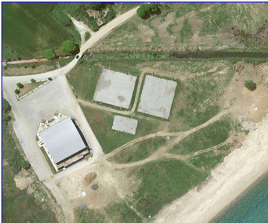
Φωτο. 3 Αποψη των ημιτελών γηπέδων (Ιερισσός)