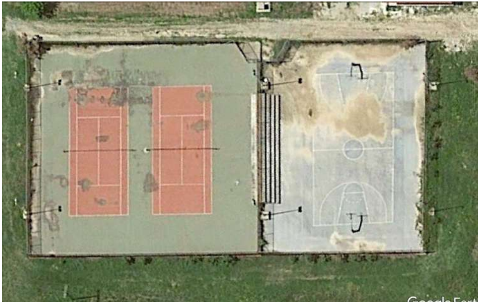
Φωτο. 4 Άποψη των γηπέδων τένις και μπάσκετ (Google Earth) (Νέα Ρόδα)

γ. Επίστρωση ελαστικού τάπητα τύπου SPORTSOL πάχους 1,6-2 χιλ. σε χρώματα πράσινο και κεραμιδί όπως στο συνημμένο σχέδιο Α1.