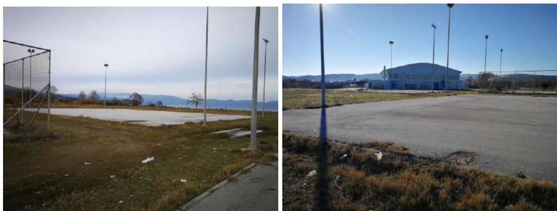
Φωτο. 1&2 Αποψη των ημιτελών γηπέδων Μπάσκετ(περιφραγμένο), Βόλεϊ και Τένις (Ιερισός)

Με την παρούσα προβλέπεται η ολοκλήρωση των γηπέδων μπάσκετ, τένις (διπλό) και βόλεϊ.