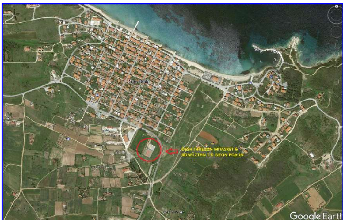
Φωτ. 2: Θέση ανοιχτών Γηπέδων Τ.Κ. Νέων Ρόδων