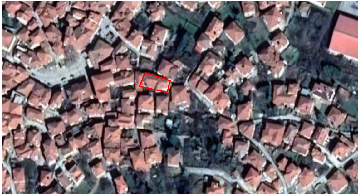
Φωτ. 1 Θέση του κτιριακού συγκροτήματος στον οικιστικό ιστό