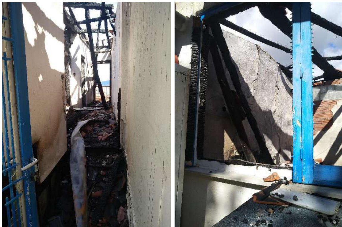
Τμήμα Β: Φωτ. 9 και 10 Χώροι του ορόφου

(χωρίς να μπορεί να διαπιστωθεί ότι όλοι και σε όλος τους το μήκος είναι από διάτρητες πλίνθους) έχουν απωλέσει σε μεγάλο βαθμό τα επιχρίσματά τους. Το δάπεδο του ορόφου δεν έχει καταρρεύσει, ήτοι δεν έχει υποστεί ολοκληρωτική καταστροφή από την φωτιά χωρίς να είναι δυνατή η διαπίστωση του μεγέθους της καταστροφής τους. Ο δυτικός τοίχος που διαχωρίζει την εν λόγω κατοικία από την κατοικία Α φέρει έντονες κατακόρυφες ρωγμές και διακρίνεται ελαφριά απόκλιση από την κατακόρυφο. Ο ισόγειος χώρος φαίνεται να μην έχει δεχθεί προσβολή από την πυρκαγιά καθώς άθικτα διατηρούνται η ξύλινη θύρα και το ξύλινο παράθυρο στο επίπεδο αυτό.