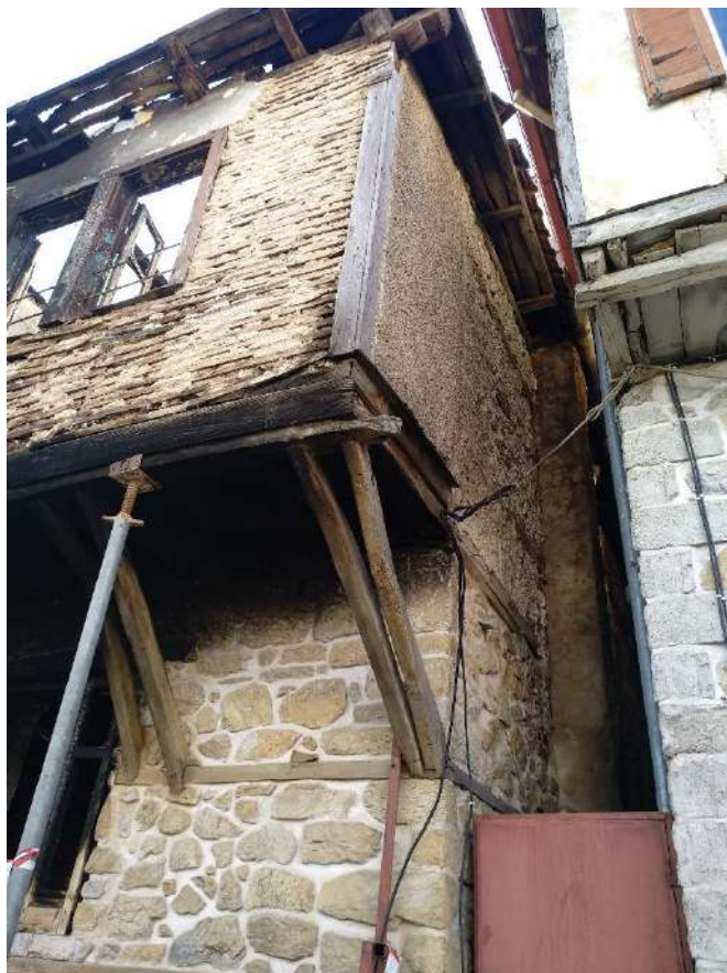
Φωτ. 15 Η βορειοανατολική γωνία του τμήματος Α όπου διακρίνεται ο λίθινος εξωτερικός τοίχος στο ισόγειο και τον όροφο.