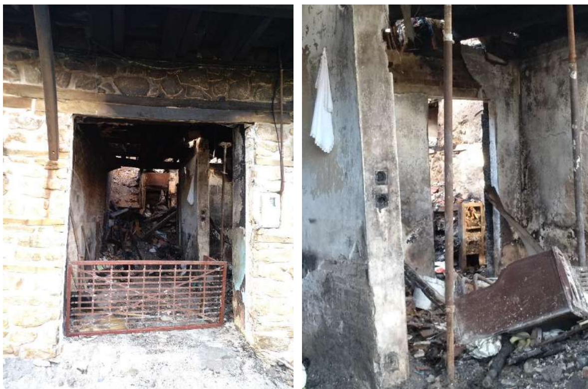
Τμήμα Α: Φωτ. 5 και 6 χώροι του ισογείου

ολοσχερώς. Στην πρόσοψη (βόρεια όψη) έχει καταπέσει το επίχρισμα του τοίχου από τσατμά στον όροφο ενώ καμένα εμφανίζονται και τα ξύλινα μέρη του εξώστη (αντηρίδες, δοκοί και υποστύλωματα). Στο τμήμα αυτό της κατασκευής έχουν εφαρμοστεί προσωρινά μέτρα προστασίας και αναλυτικότερα έχει γίνει πρόχειρη υποστήλωση του στεγασμένου εξώστη εξωτερικά καθώς και δοκών του δαπέδου ορόφου στο εσωτερικό.