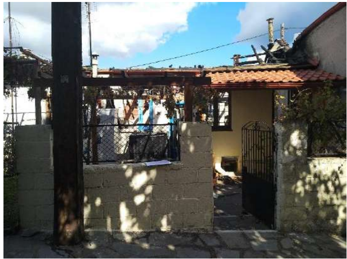
Φωτ. 11 Αριστερά, εσωτερικός χώρος του ορόφου του τμήματος Γ και Φωτ 12 Η νότια όψη των τμημάτων Β και Γ (απεικονίζεται ο όροφος)