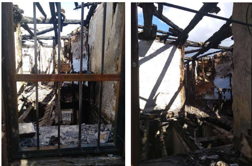
Τμήμα Α: Φωτ. 7 και 8 Χώροι του ορόφου

Στο τμήμα Β (Καραγιάννη Γεώργιου), έχει καεί και καταρρεύσει ολοσχερώς η κεραμοσκεπή και οι ξύλινες δοκοί - υποδομή αυτής, είτε βρίσκονται καμένες στην θέση τους είτε αιωρούνται στο κενό. Τα ξύλινα κουφώματα του ορόφου έχουν καεί, επίσης, ολοσχερώς. Οι διαχωριστικοί τοίχοι του ορόφου που είναι από διάτρητες πλίνθους