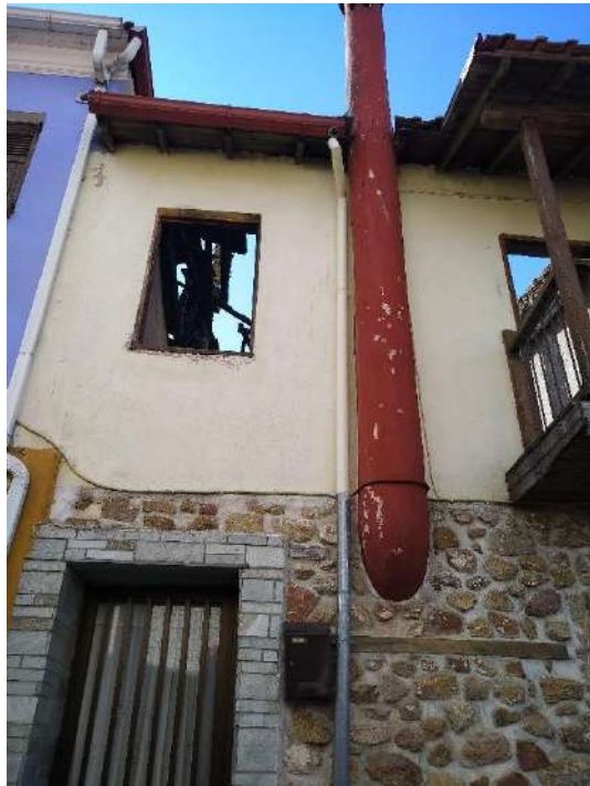
Φωτ 13 και 14 Η βόρεια όψη (πρόσοψη) του τμήματος Γ