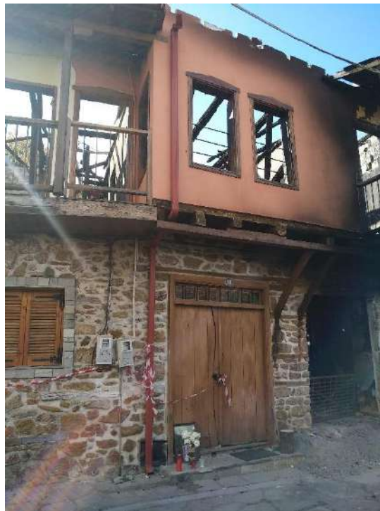
Φωτ. 3 Αριστερά το τμήμα Α (Ρεπάνη Γεώργιου) της κατασκευής και Φωτ. 4 Δεξιά το τμήμα Β (Καραγιάννη Γεώργιου) της κατασκευής

Το κτίσμα είναι διώροφο από την βόρεια πλευρά του και ισόγειο από την νότια, λόγω της υψομετρικής διαφοράς στην συγκεκριμένη θέση.